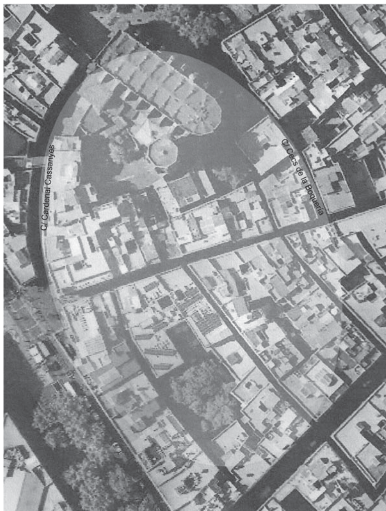
Fig. 1. Huellas fosilizadas de la planta del hipotético anfiteatro en la trama viaria de Barcelona con la silueta superpuesta de una elipse geométrica generada por ordenador. La iglesia de Santa Maria del Pi es claramente visible (dibujo de M. Valls, según indicaciones del autor).

La posible situación de un anfiteatro (o «arenas») en el estudio del origen de los diversos topónimos cercanos a la silueta fosilizada («les arenas», «Santa Eulàlia» y «la Palma») ha llevado a lecturas alternativas de diversos documentos tardo-antiguos y medievales. Estas interpretaciones invitan a reflexionar sobre el origen tradicional de «Santa Maria de les Arenes», que desde el siglo XIV se ha relacionado con la iglesia martirial de Santa Eulàlia. Una antigua tradición que hasta el momento solo está documentada por escritos muy modernos. Por ello, la exposición y defensa de la hipótesis sobre el anfiteatro que aquí se plantea se complementa con una serie de reflexiones sobre el posible origen de los topónimos que están directamente relacionados con la problemática.