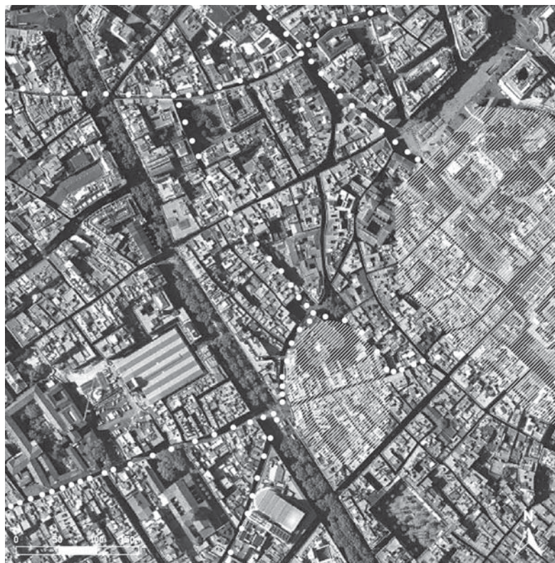
Fig. 2. Vías romanas en el cuadrante noroeste del recinto amurallado romano. Abajo, en el centro, la iglesia de Santa María del Pi (dibujo de M. Valls, según el anexo fotográfico de Busquets et al. 2009 e indicaciones del autor).

El posible anfiteatro sería de dimensiones considerablemente grandes con relación a la escasa extensión del recinto urbano amurallado de Barcino . Sobre el plano de la ciudad romana (Beltrán de Heredia, 2010a), las grandes infraestructuras de representación, como son el foro o el templo de la ciudad, están en proporción con la gran estructura del anfiteatro que proponemos. 3 El aforo de anfiteatros con dimensiones comparables se estima en más de 10.000 espectadores y en Barcino se supone que habitaban alrededor de 2000 personas (Rodà, 2001: 24). 4 La diferencia numérica no es relevante, dado que las grandes estructuras para la celebración de espectáculos estaban destinadas tanto a la población urbana como a la del territorio. Ciudades con superficies urbanas mucho menores disponen