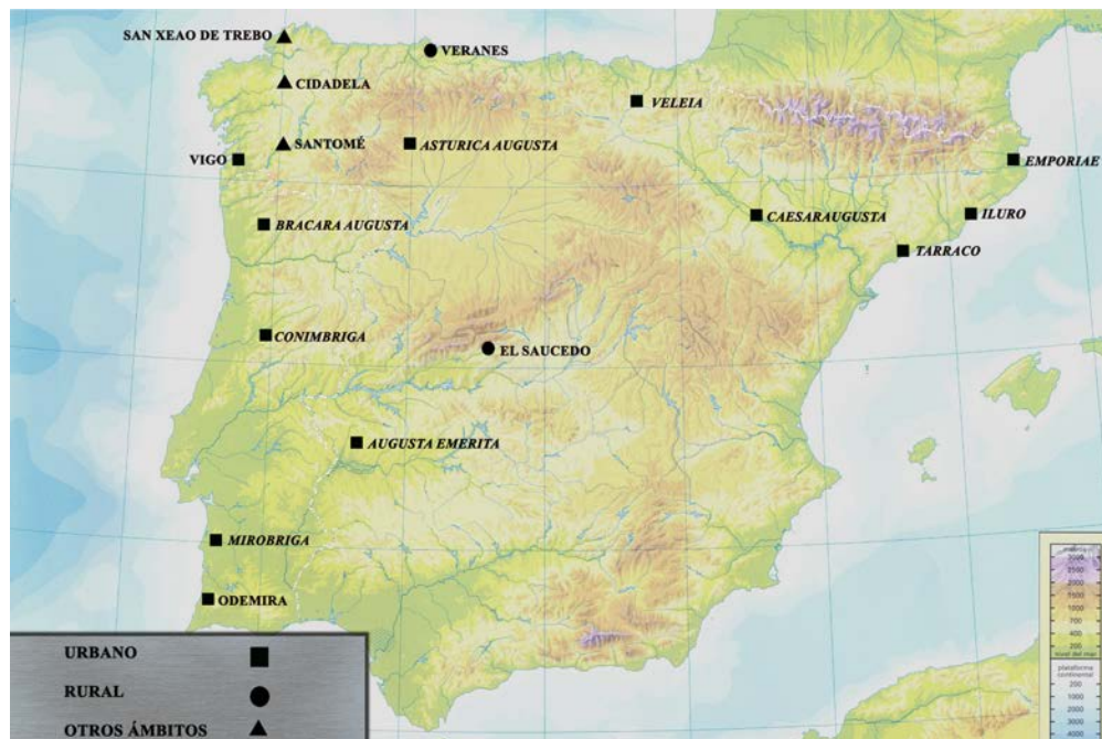
Figura 1. Mapa de distribución de los vidrios con inscripción grabada en Hispania .