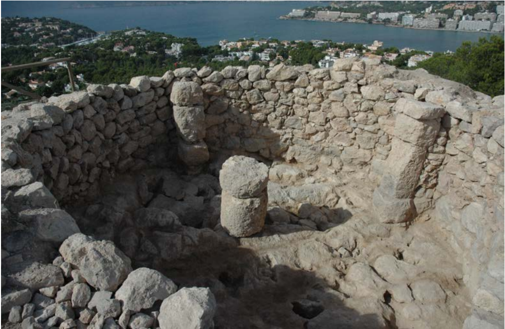
Figura 4. Puig de sa Morisca; vista desde el mar y la torre III, situada en la cima de la colina.

Sin embargo, debemos tener en cuenta algunos elementos a la hora de contextualizar e interpretar los cambios que en las narrativas propuestas se están dando en esta última década.