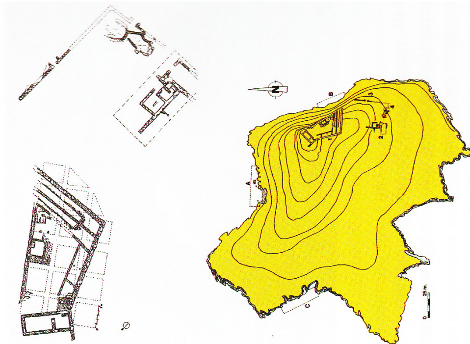
Figura 2. Factoría púnica de Na Guardis y planimetría de las zonas excavadas por Víctor Guerrero.

mentos que definieron el modelo colonial que se proponía para este período. La edición de los primeros resultados de la excavación coincidirá en el tiempo con la publicación de los primeros trabajos que defendían un modelo colonial asimétrico.